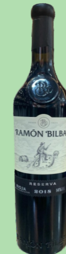
RAMÓN BILBAO TEMPRANILLO 35 €