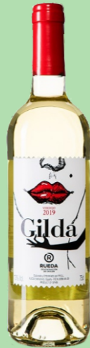
GILDA 100% VERDEJO 18 €