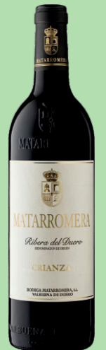
MATARROMERA RIBERA DEL DUERO 38 €