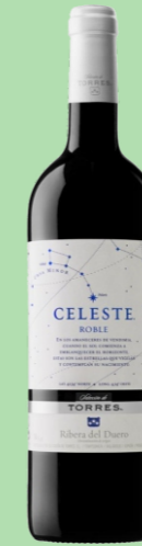
CELESTE ROBLE RIBERA DEL DUERO 22 €