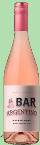
EL BAR ARGENTINO 100% MALBEC 19 €