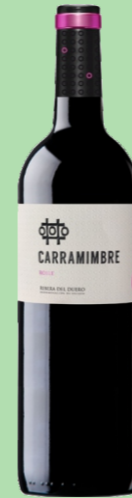
CARRAMIMBRE RIBERA DEL DUERO 22 €