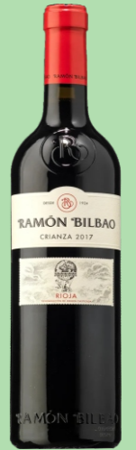
RAMÓN BILBAO 14 MESES BARRICA 22 €