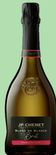
JP. CHENET BLANC DE BLANCS ESPUMOSO BRUT 22 €

El vino añejo y el amigo viejo, son de mucho valor