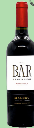
EL BAR ARGENTINO 100% MALBEC 22 €