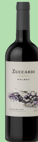
ZUCCARDI MALBEC 10 MESES BARRICA 28 €