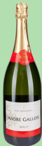
CAVA ANDRÉ GALLOIS ESPUMOSO BRUT 18 €