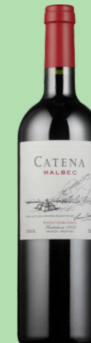
CATENA MALBEC 14 MESES BARRICA 35 €